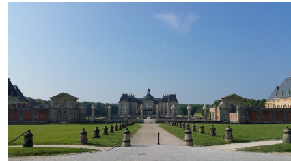
Présentation à Vaux-le-Vicomte du livre réalisé dans le cadre du projet.